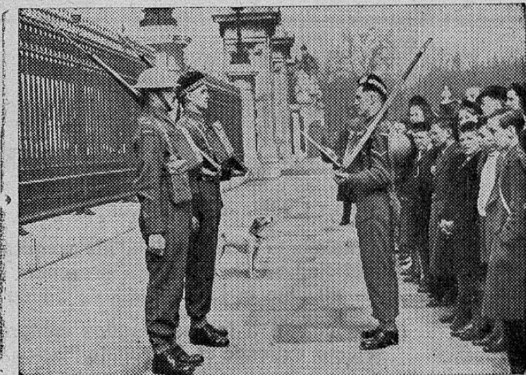
Guardias escoceses frente al palacio de Bukinghan